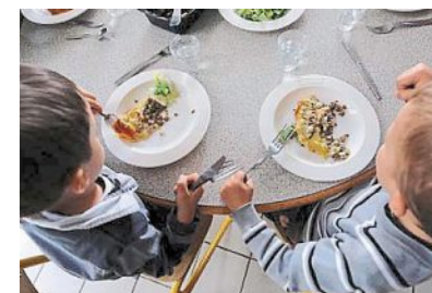
Les familles devront fournir un pique-nique mardi, dans les écoles touchées par la grève.

Une grève est annoncée mardi 10 octobre, dans les écoles nantaises, avec des risques de fermeture. « Des perturbations sont attendues sur le temps scolaire et périscolaire. La situation des écoles sera connue lundi après-midi », lit-on seulement sur le site de la Ville de Nantes. Cette situation sera consultable à 14 h sur nantes.fr/greve. Dans un communiqué, les élus nantais de la droite et du centre disent « regretter le manque d'anticipation de la municipalité » : « La Ville se doit, dans ces circonstances, de mettre en place un service minimum d'accueil. À ce jour, lorsque les parents cherchent à obtenir des informations pour savoir comment inscrire un enfant, et quels lieux seront ouverts et en mesure de les accueillir, AlloNantes répond : « Nous n'avons pas d'informations pour le moment, merci de bien vouloir rappeler lundi prochain ». Lundi, la veille de la grève ! Chacun sera en mesure d'imaginer ce que cela implique en termes d'organisation pour les familles. [...] Ce que les familles nantaises en re-