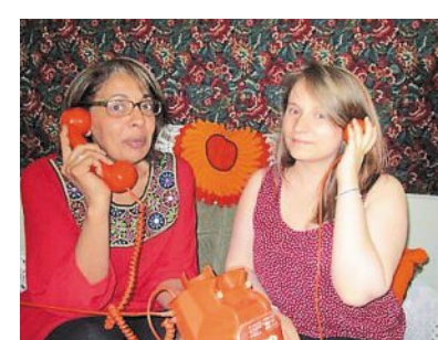
Un quartier vivant grâce à toutes les animations de l'association de théâtre PaQ' la Lune.